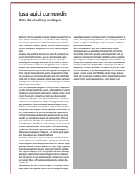
1/4 Seite hoch