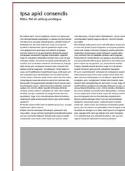
1/4 Seite quer