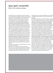
1/4 Seite quer